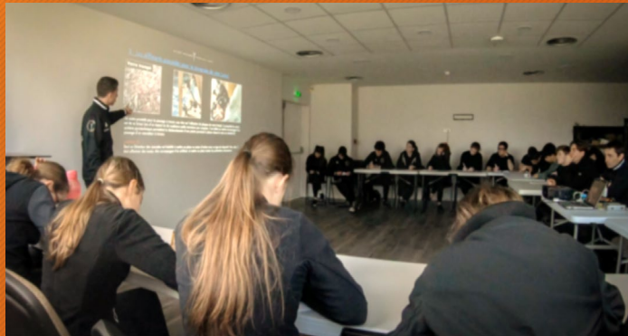
Salles de cours